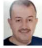
رئيس بقبروس كورينا.

من العلامات الفارقة في التعديل الذي أجراه الدكتور بشر خصاونة على حكومته بتأييد ومباركة جلاله الملك يوم الأحد- إسناد حقيبة التربية والتعليم والتعليم العالي لوزير واحد. رأى فيه الرئيس كفاءة ومقدرة على النهوض بأعبائهما في آن معاً. وفي ذلك أكثر من قراءة للمشهد في مقدمتها ما ذهب إليه خصاونة في خطوة قصد منها تقلييل عدد فريق حكومته ثم إطلاعها على الفواصم المشتركة بين اختصاصات الوزارتين من ناحية أنهما يُعنىان بالتعليم الذي يتجه في شقه الواسع إلى النمط الإلكتروني خاصة في ظل تطورات الوضع الوبائي الذي نأثر به